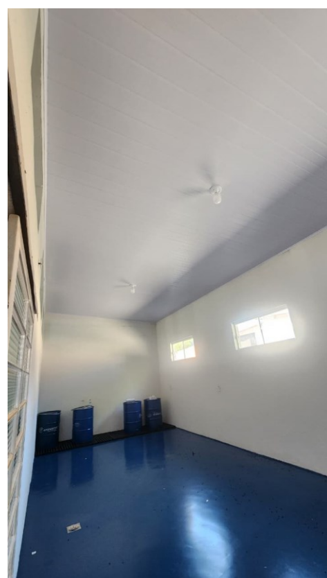
Figura 20 Depois sala de embalagem vazia