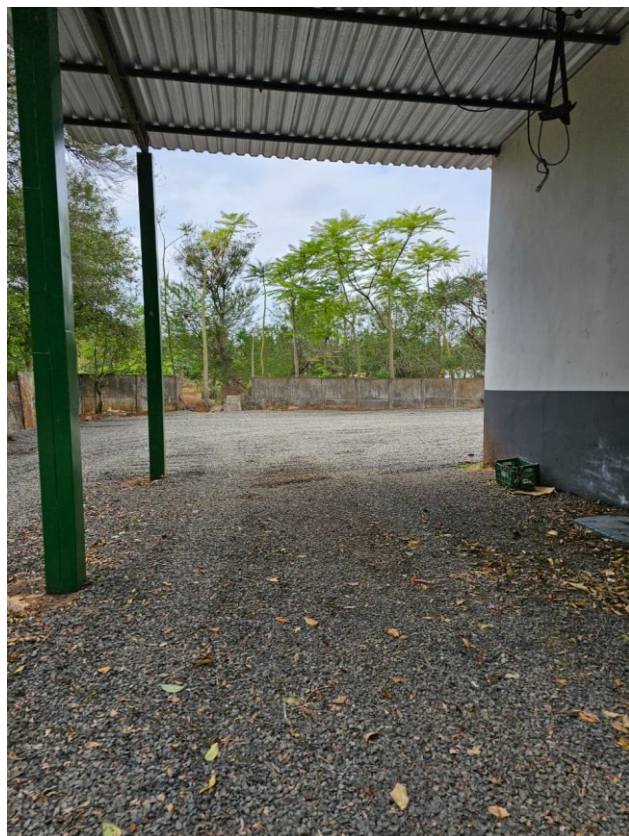
Figura 3 Pedra Brita visão de traseira