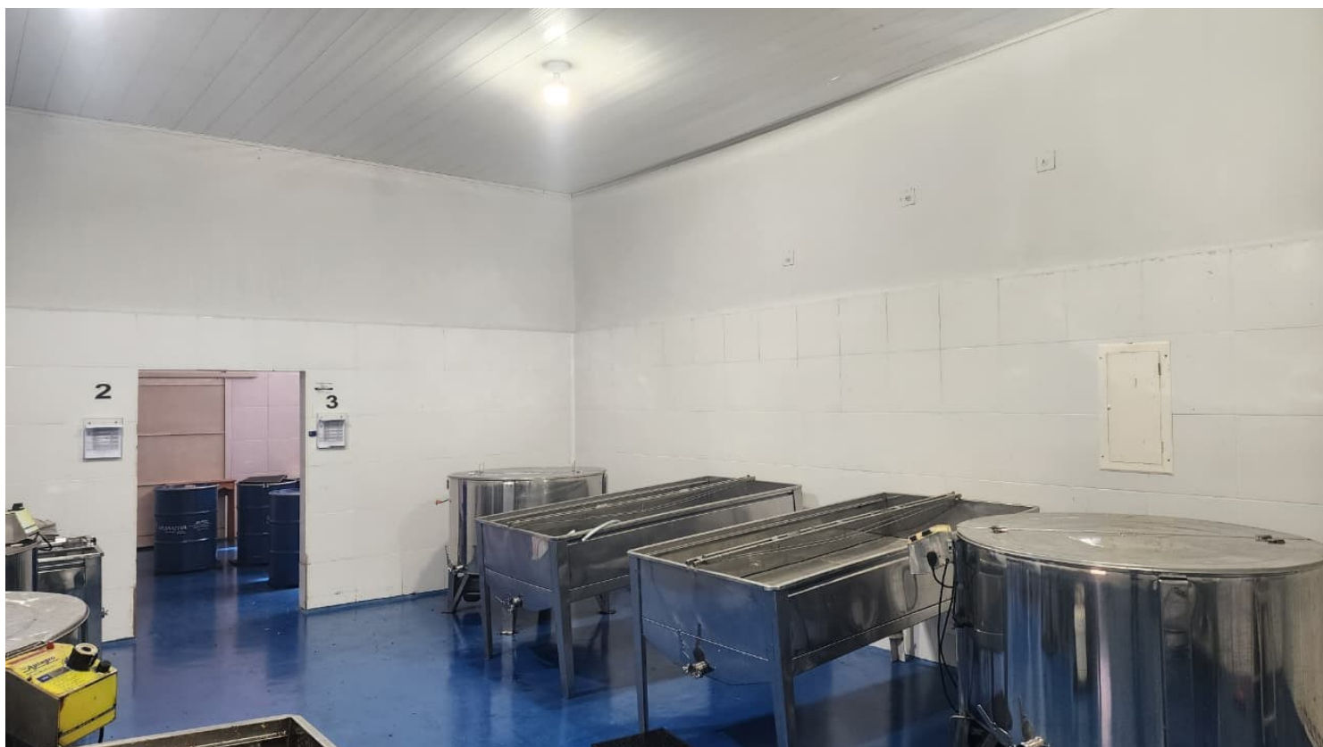
Figura 13 Pintura interna Sala de extração