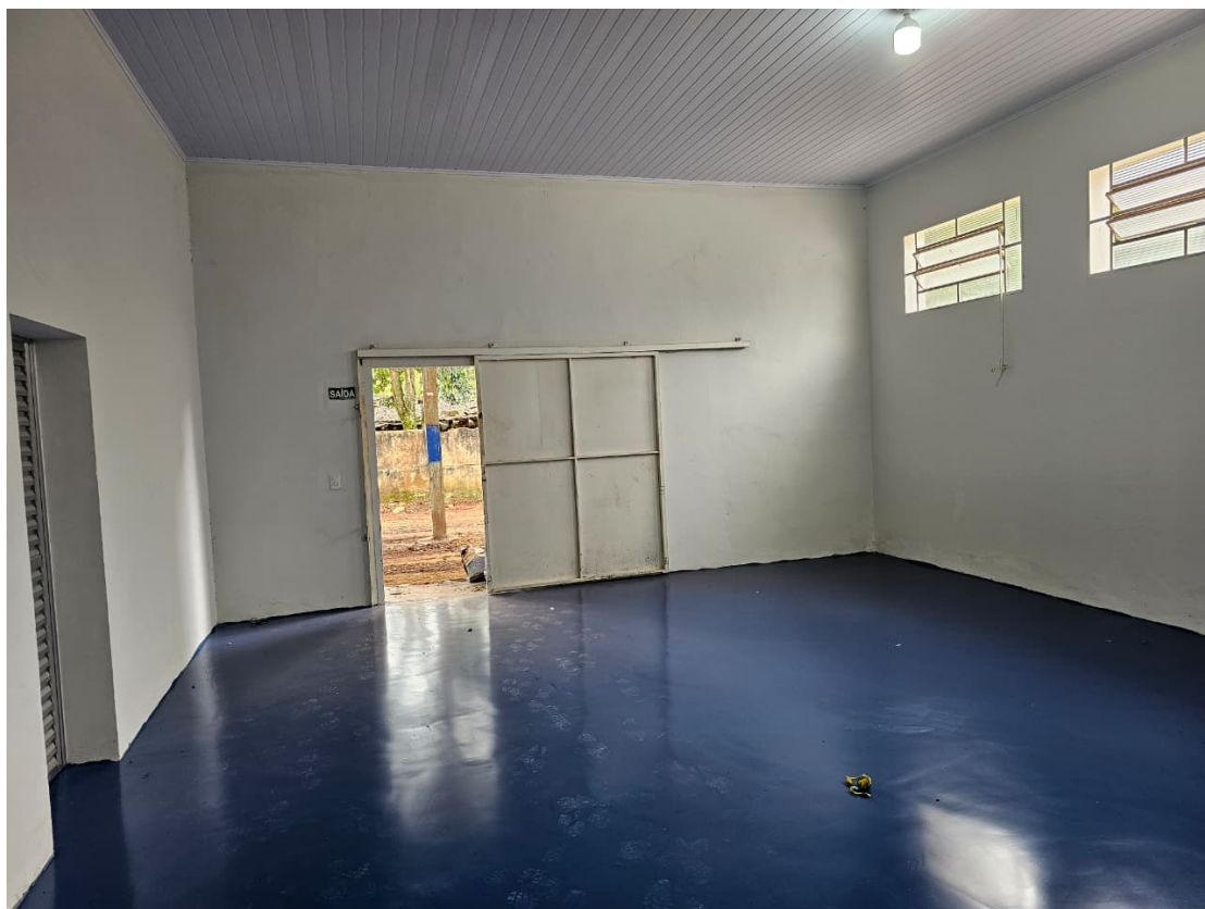
Figura 9 Revestimento de Uretano expedição