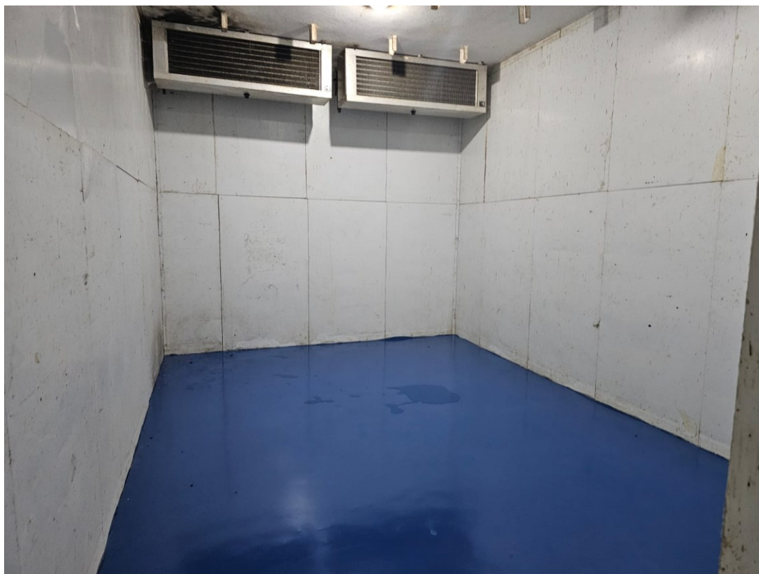
Figura 5 Revestimento de Uretano deposito de melgueiras