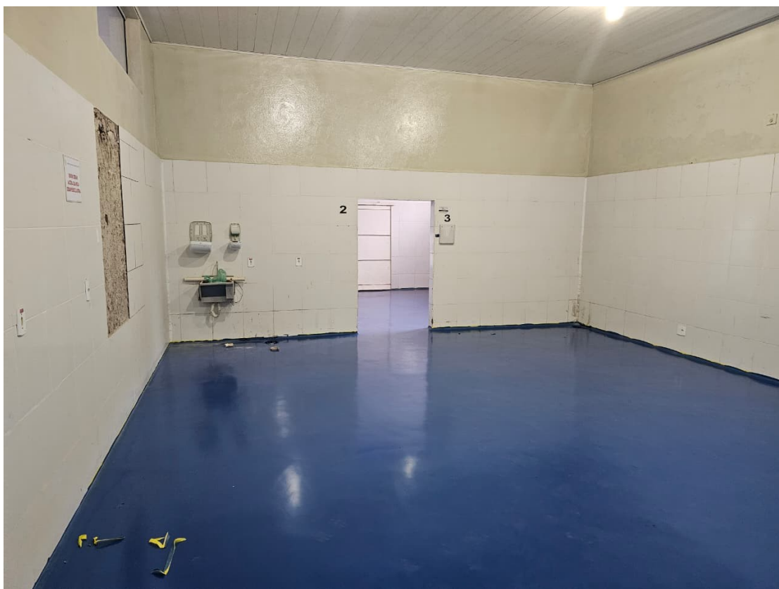
Figura 6 Revestimento de Uretano sala de extração