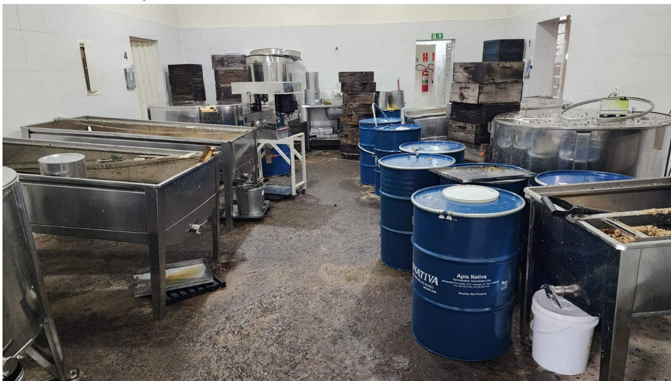
Figura 16 Antes sala de extração