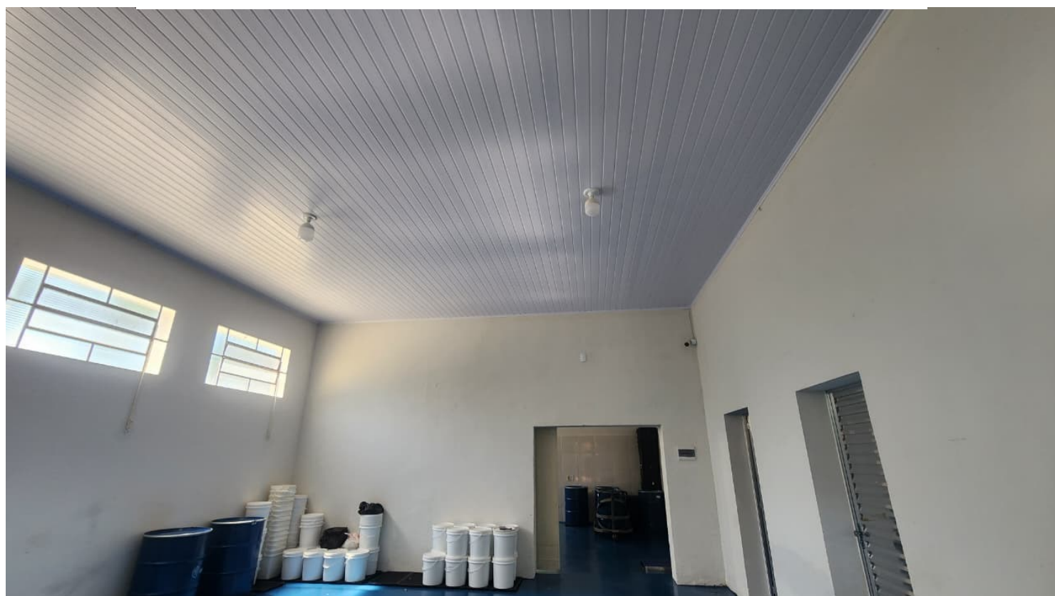
Figura 10 Forro PVC expedição