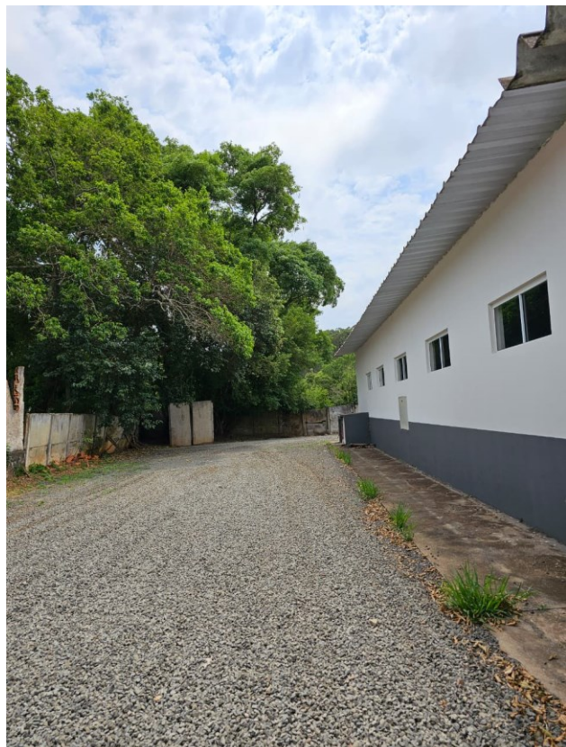
Figura 1 Pedra Brita visão Lateral