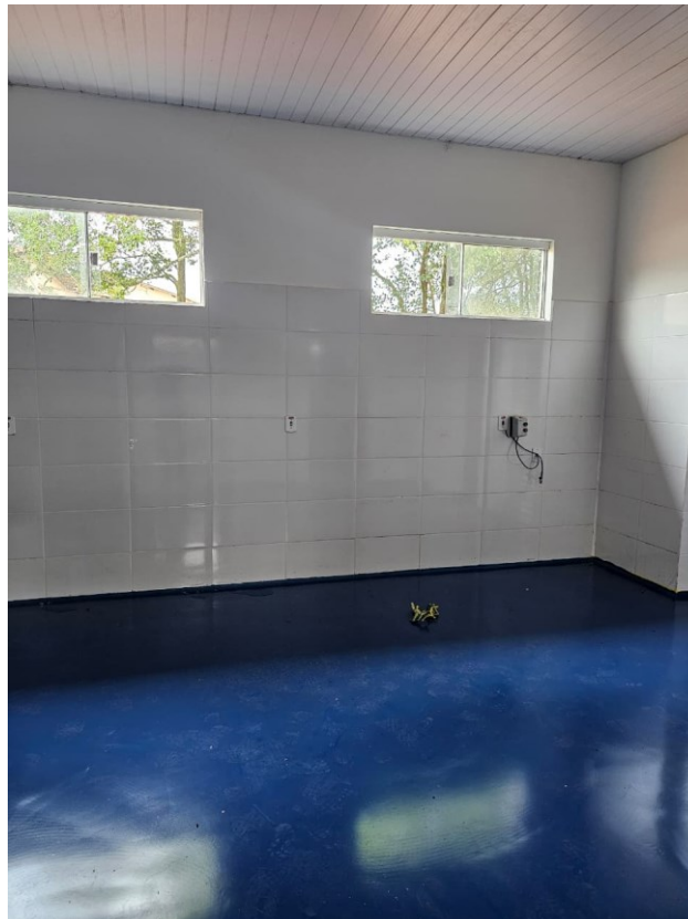
Figura 8 Revestimento de Uretano sala de sache