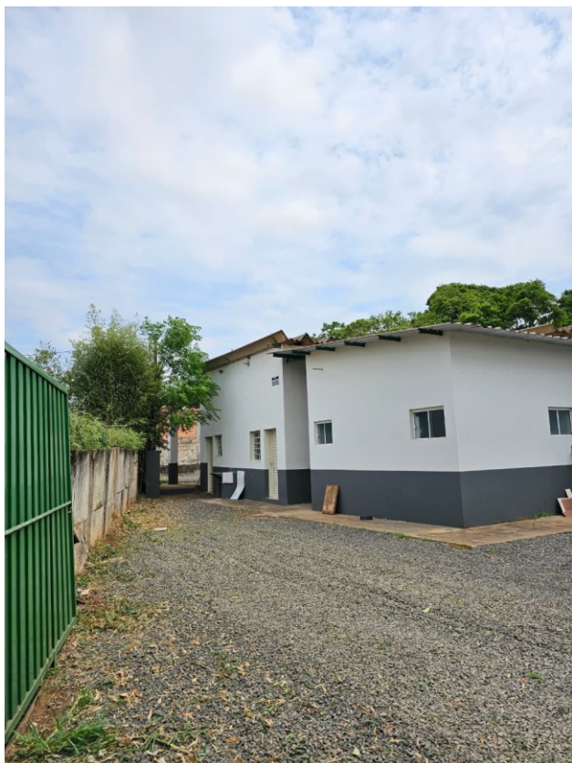
Figura 4 Pedra Brita visão de frontal