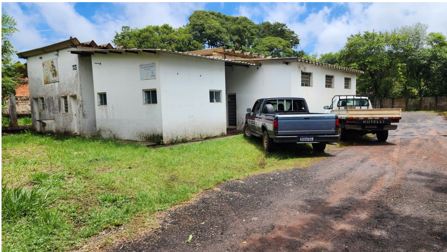
Figura 22 Antes Casa do Mel