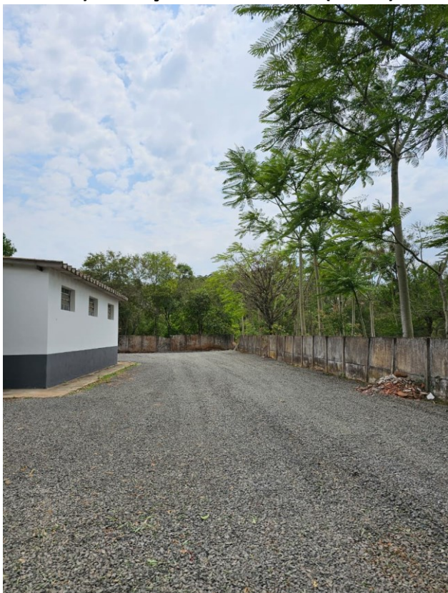
Figura 2 Pedra Brita visão Lateral