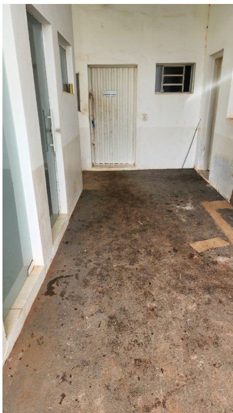
Figura 18 Antes entrada casa do mel