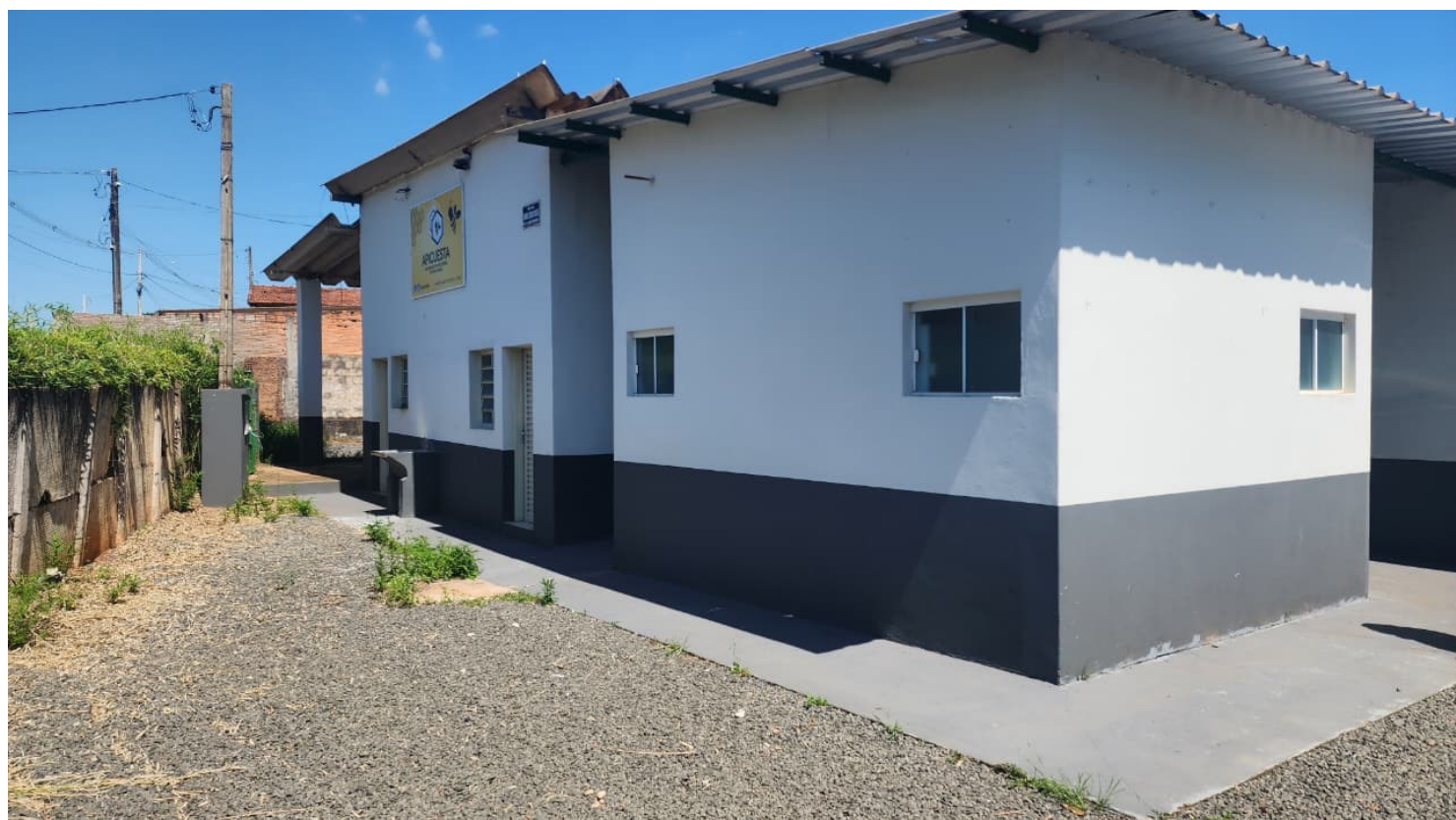
Figura 15 Pintura externa

Tel: (14) 99697-5852 (Joel) Email: aapc_apicultura@hotmail.com