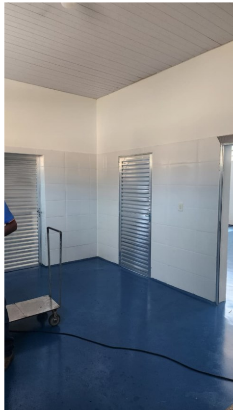
Figura 12 Pintura interna - sala de sachê