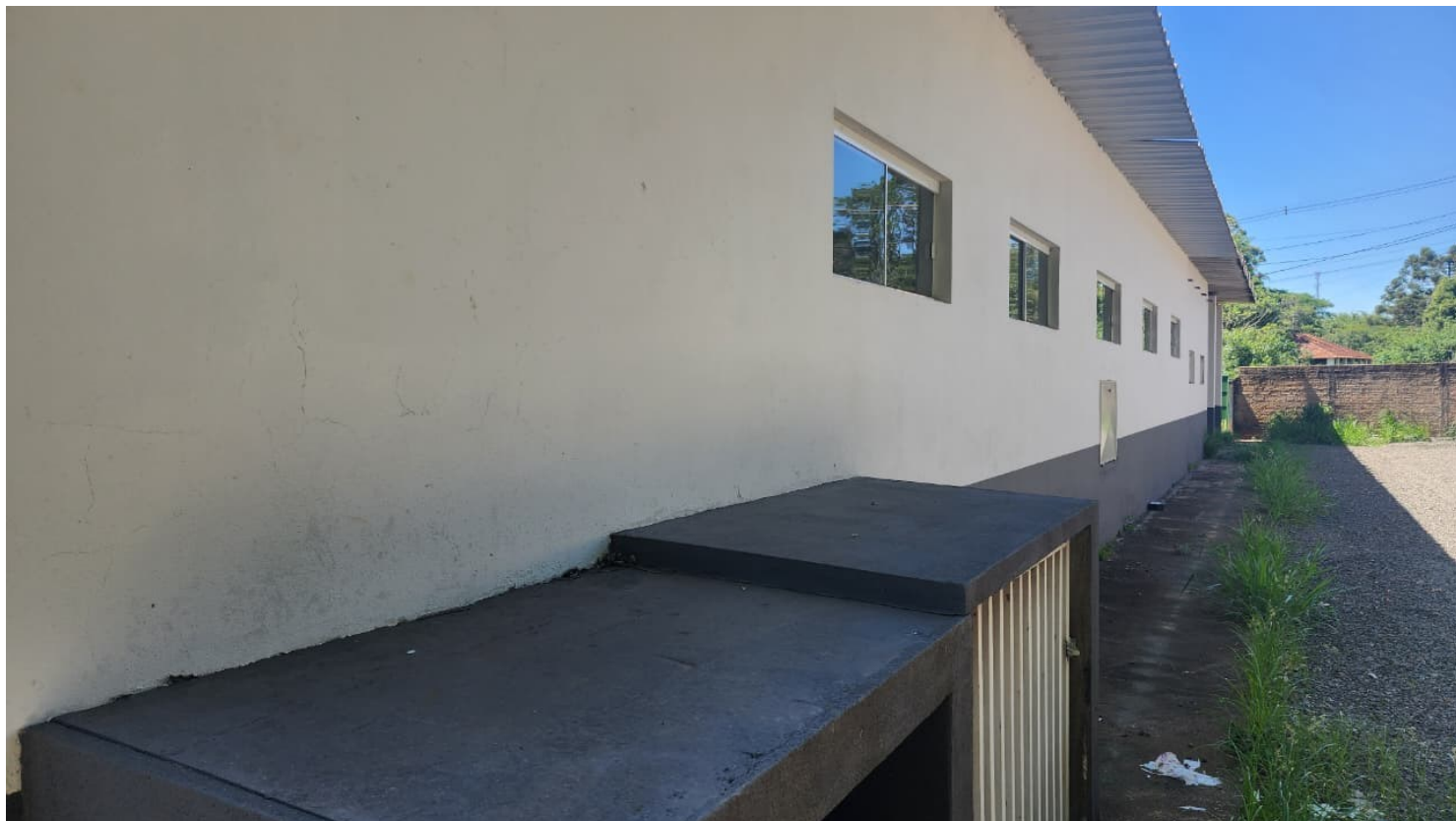
Figura 14 Pintura externa