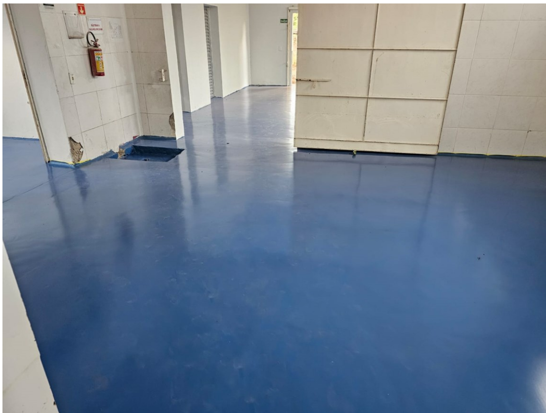
Figura 7 Revestimento de Uretano sala de envase