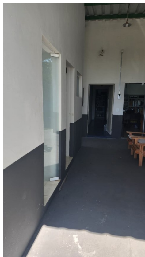
Figura 19 Depois entrada casa do mel