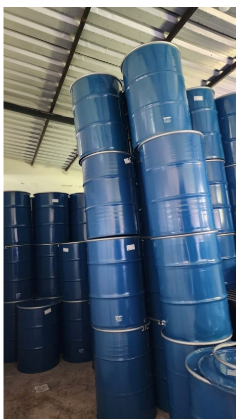
Figura 21 Antes sala de embalagem vazia