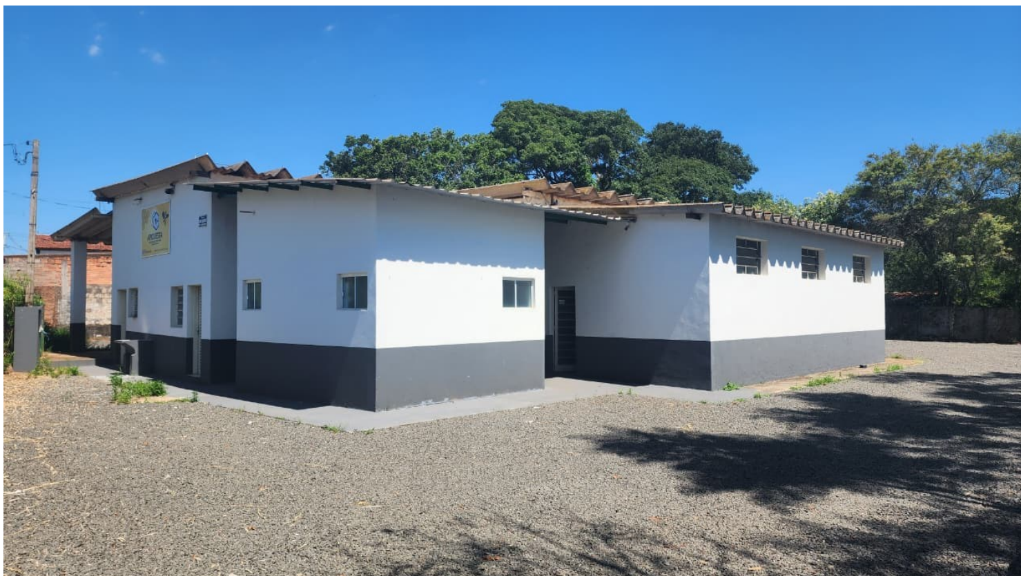
Figura 23 Depois Casa do Mel